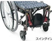
スイングイン機構

フット・レッグサポートを内側へ格納・外側へ開放が可能。握りながら真上に引き抜いて着脱することができます。スペースがない場所に選んでいます。