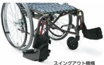
スイングアウト機構